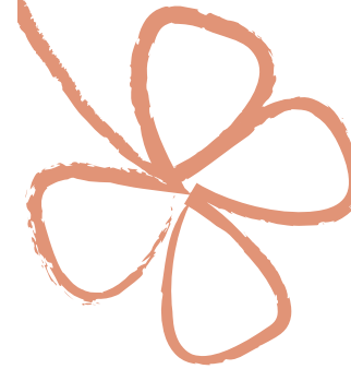
Olga Löser PTA, Darmfachberaterin